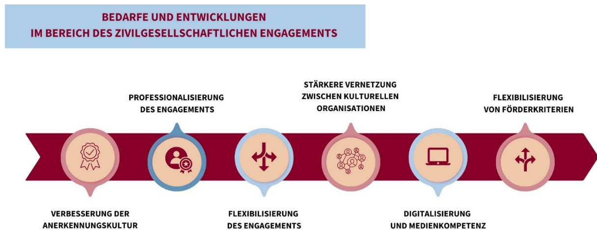
Abbildung 2: Bedarfe und Entwicklungen im Bereich des zivilgesellschaftlichen Engagements (eigene Darstellung)